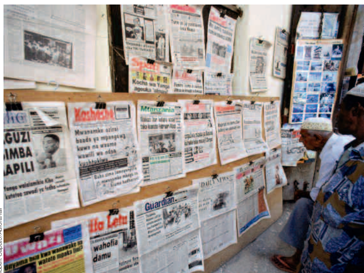
Die Rückgabe blockierter Vermögenswerte aus Korruption bindet die Schweiz in Angola (links) an Entminungsprojekte, in Tansania (rechts) kämpft sie mit der Unterstützung investigativer Medien gegen Korruption.

Wie schwierig es zuweilen ist, die eigenen Integritätsgrundsätze im korrupten Umfeld eines Entwicklungslandes umzusetzen, zeigen zahlreiche Beispiele. Transparency International Schweiz organisiert zweimal jährlich einen Erfahrungsaustausch, der bei Mitarbeitenden der Schweizer Entwicklungszusammenarbeit auf grosses Interesse stösst: Hier können gemeinsam Fälle diskutiert und Lösungen gesucht werden.