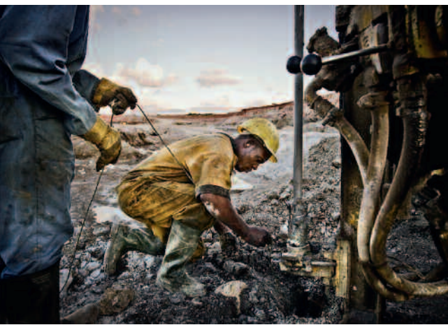
Die Demokratische Republik Kongo ist eines jener Länder, die aufgrund des Rohstofffluchs stark unter Korruption leiden.