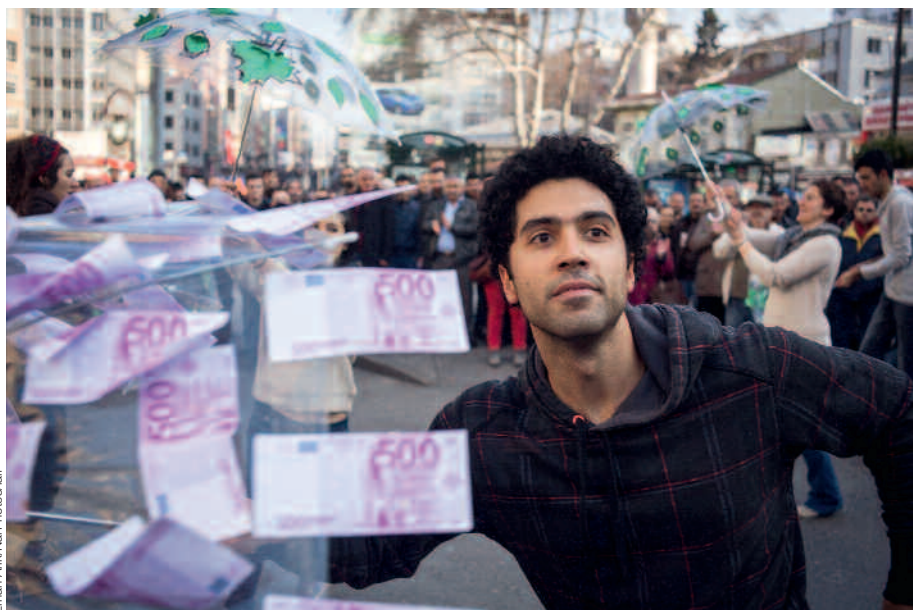
Sowohl in Spanien (links) als auch in der Türkei (rechts) gingen vergangenes Jahr Menschen auf die Strasse, um gegen korrupte Politiker zu demonstrieren.

steht sich. Damit ist beiden geholfen: Der Fahrer behält den Ausweis und erspart sich kostspielige Umwege, während der Polizist Buss- und Bestechungsgeld in die Tasche steckt.