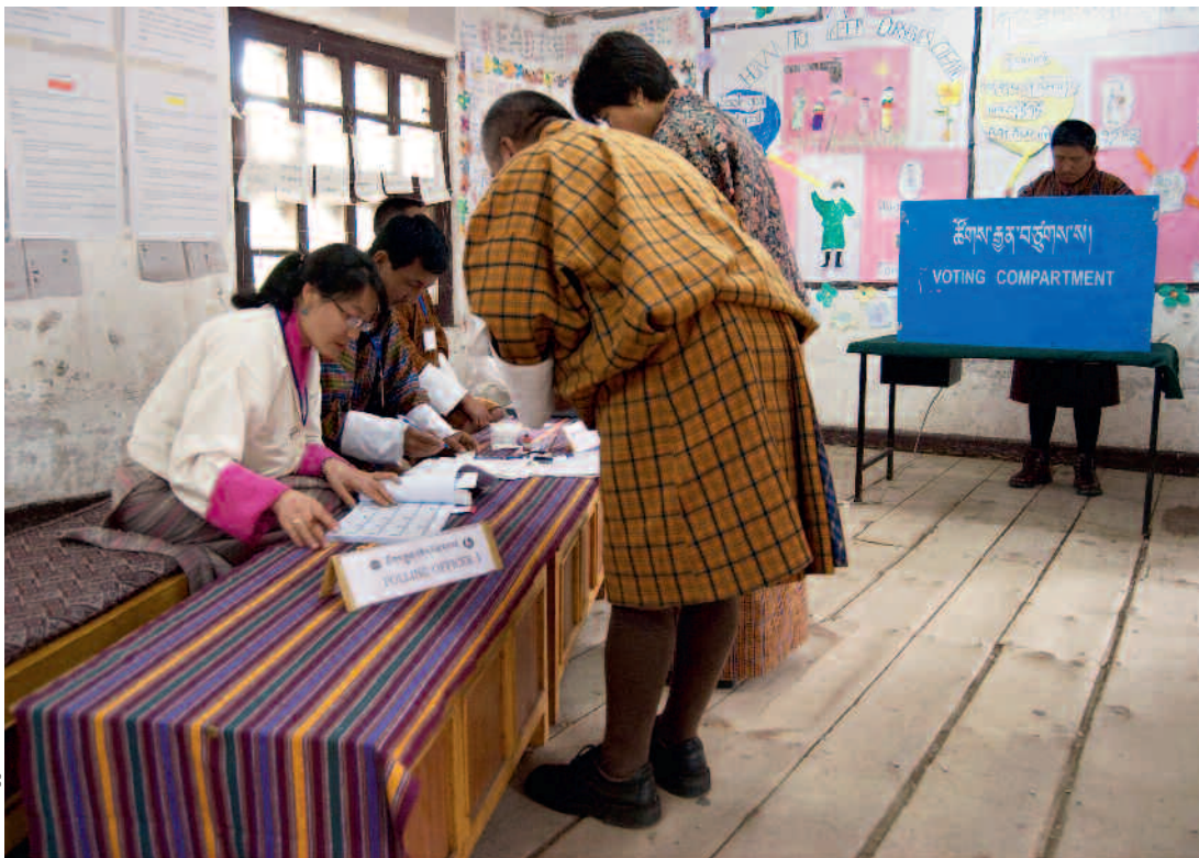
Aufgedeckte Korruptionsfälle beeinflussten im Mai 2013 die Wahlen in Bhutan.

Das kleine Königreich Bhutan steht mitten in einer doppelten Herausforderung: Nach langer Zeit der Abschottung öffnet der Himalayastaat seine Grenzen der globalen Wirtschaft und befindet sich gleichzeitig auf dem Weg zur Demokratie. Eine wichtige Rolle kommt in diesem Prozess der nationalen Antikorruptions-Kommission zu, deren Aufbau von der Schweiz unterstützt wird.