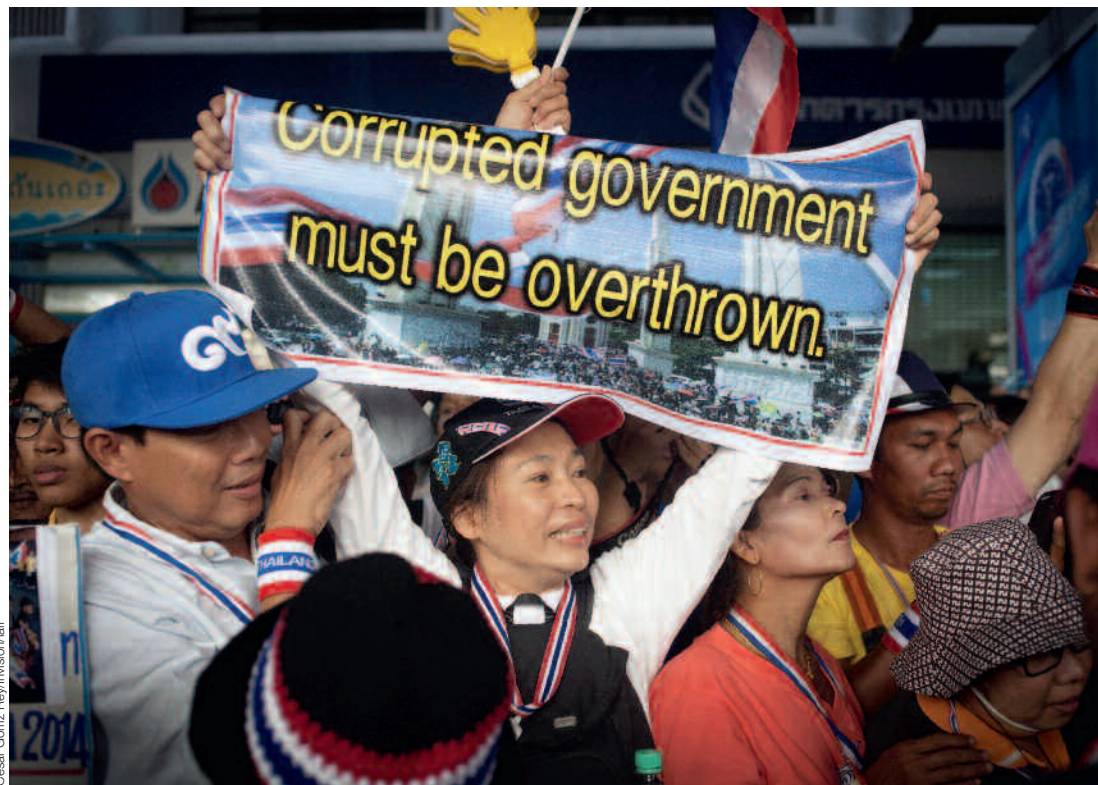
Genau wie in Thailand zu Beginn dieses Jahres wehren sich weltweit immer mehr Menschen dagegen, dass auf ihrem Buckel korrupt gehandelt wird.

Der Begriff Korruption umfasst von Vetternwirtschaft bis Veruntreuung unzählige Spielarten unlauterer Geschäfte. Transparency International definiert Korruption als «Missbrauch anvertrauter Macht zum privaten Nutzen oder Vorteil». Generell unterscheidet man zwei Formen von Korruption. Die eine ist erpresserischer Art und ist vorab in Entwicklungsländern weit verbreitet: Eine Machtstellung wird ausgenutzt, um dem Gegenüber eine Sonderleistung abzunötigen. Die andere Form besteht in einer Win-Win-Situation: Wie bei einem Tausch, profitieren die Direktbeteiligten, allerdings zu Lasten Dritter. Die Folgen reichen von materiellen Schäden bis zur Zersetzung staatlicher und gesellschaftlicher Strukturen. Juristisch unterscheidet man zwischen aktiver und passiver Korruption – also jenen, die Bestechung anbieten, und jenen, die sich bestechen lassen.