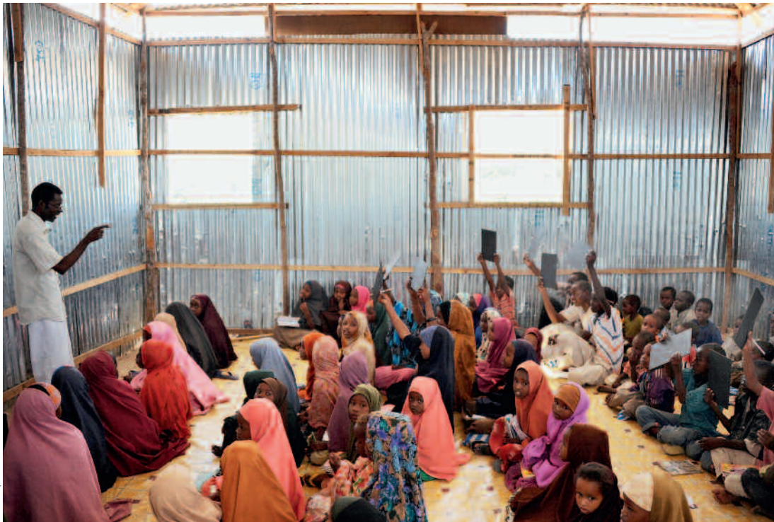
Werden öffentliche Mittel in private Taschen abgezweigt, leidet wie hier in Somalia meist auch die Bildung.

der aus Korruptionsgeschäften (Asset Recovery). Würden die geforderten Standards in allen 140 Staaten, welche die Konvention ratifiziert haben, effizient umgesetzt, könnten korrupte Praktiken wirksam eingedämmt werden. So müssen heute nicht nur öffentliche Verwaltungen Reglemente und Kontrollsysteme zur Korruptionsbekämpfung bereitstellen, auch in der Privatwirtschaft leisten sich immer mehr Unternehmen eigene Compliance-Abteilungen, um kostspieligen und rufschädigenden Korruptionsfällen vorzubeugen. Die Einführung neuer Strafnormen hat in vielen Ländern dazu geführt, dass korruptes Handeln nun von Gesetzes wegen verfolgt wird, was eine nicht zu unterschätzende präventive Wirkung haben dürfte.